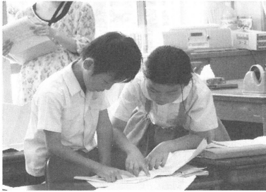
ペアでの話し合いの様子

学級全体での話し合いでは、児童から出た放送で紹介したいという思いは、選ぶという話し合いに対する必要性をもたせるためには十分な動機づけとなった。しかし、児童H, J, K, Lがお話の感想から選んだ理由を述べているのに対して、児童C, D, Gは、「勉強になるから」という発言をしている。これは、相手にとってどの神話