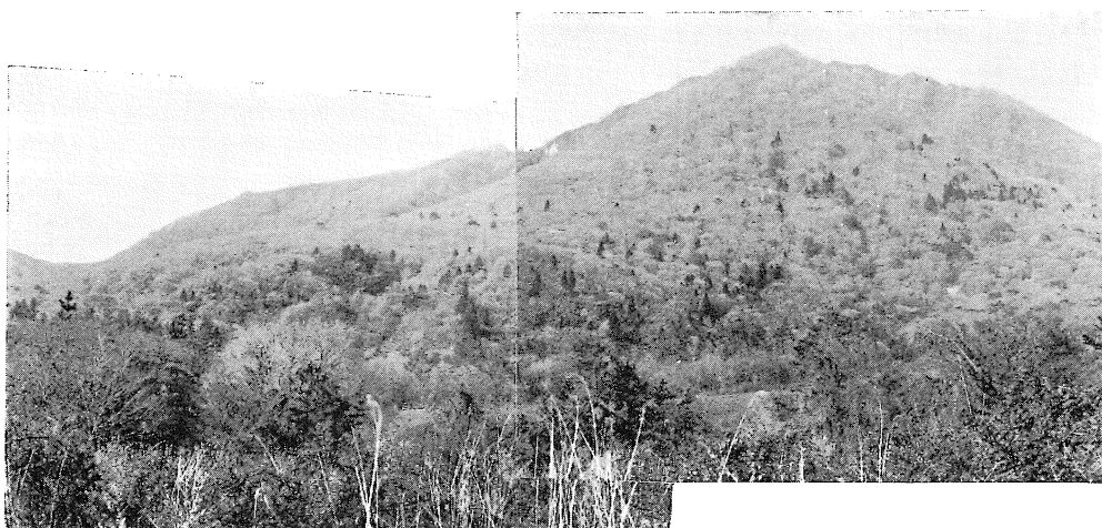
第3図 三瓶山北斜面全景 イヌシデ群落内に天然生のスギがみられる

ある。クロモジ、ホツツジのほかにおオカメノキ、アクシバ、コアジサイなどが多く出現する種類である。中国山地のブナ帯にまでみられるエゾユズリハ・ヒメモチなどは今回の調査地内には出現していない。また、この北斜面上部は 40^{\circ}\sim 45^{\circ} 前後の急斜面であり、林内は非常に湿潤でササ類の生育はほとんどみられなかった。草本層には、林内全域に優占するものはほとんどなく、シシガシラ・オオカニコウモリ・ミヤマカタバミ・ニシノホンモンジスゲ・コバノフユイチゴ・アキノキリンソウ・チゴユリ・ヤマシロギク・カンスゲなどがいずれも出現度のかなり高い植物といえる。