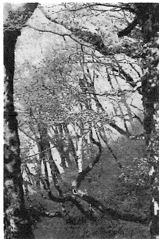
第2図 ブナ群落内の様相