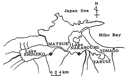
Fig. 1. Map of Lakes NAKANOUMI and SHINJIKO