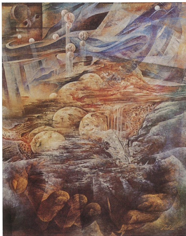
「浸食Ⅱ」(1997) 162.1×130.3 油彩