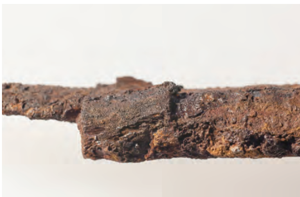
4 鉞 2 にみる把縁の段差