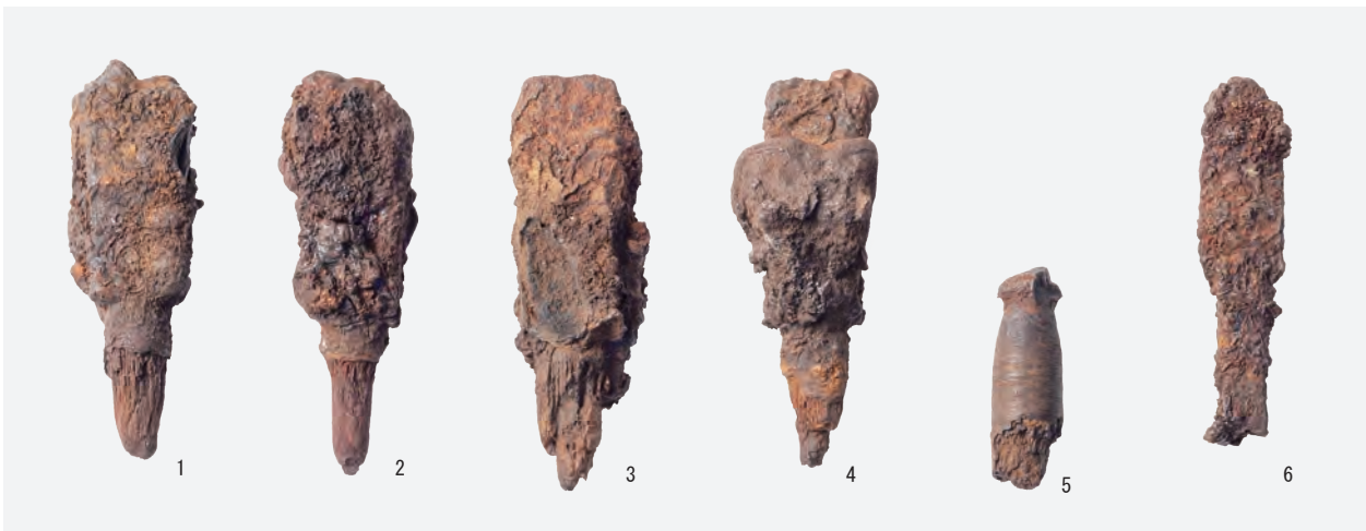
7 鉄 鏃