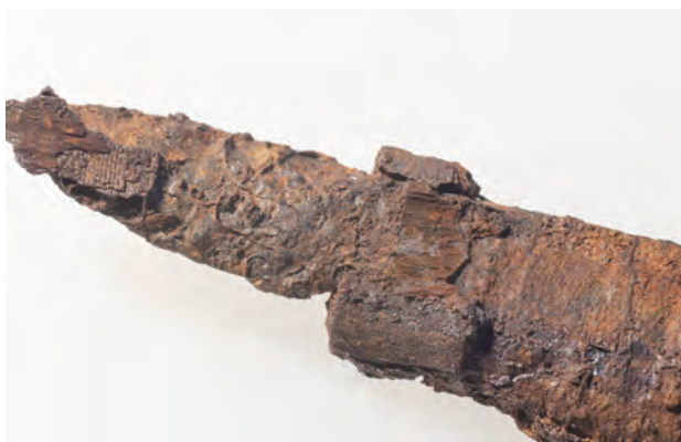
3 鉞 2 の把縁の形態