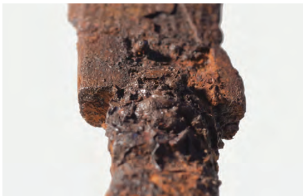
7 鉞 12 の把縁の形態 (2)