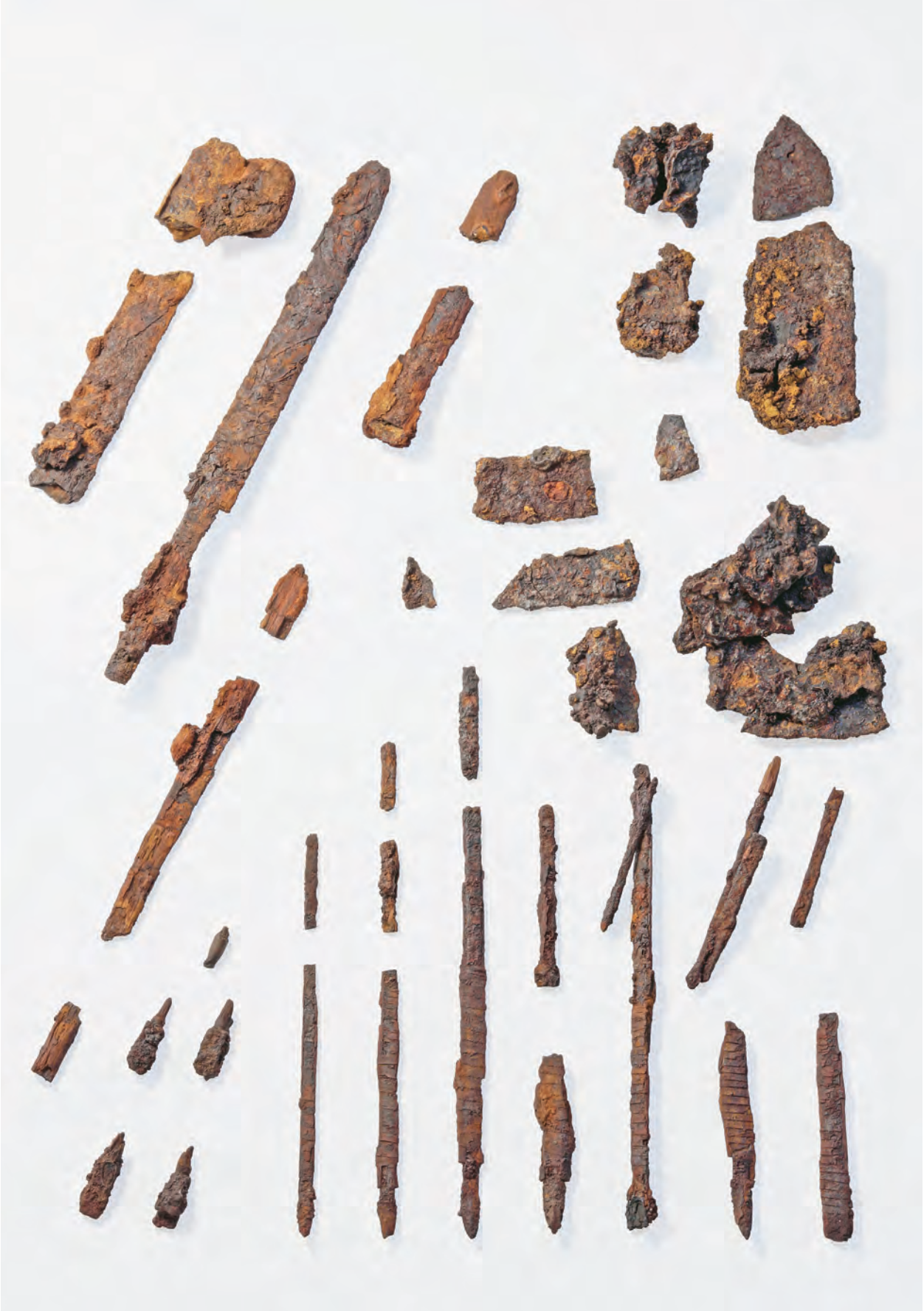
伯耆国分寺古墳出土武器・農工具