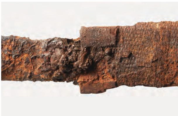
6 鉞 12 の柄縁の形態 (1)