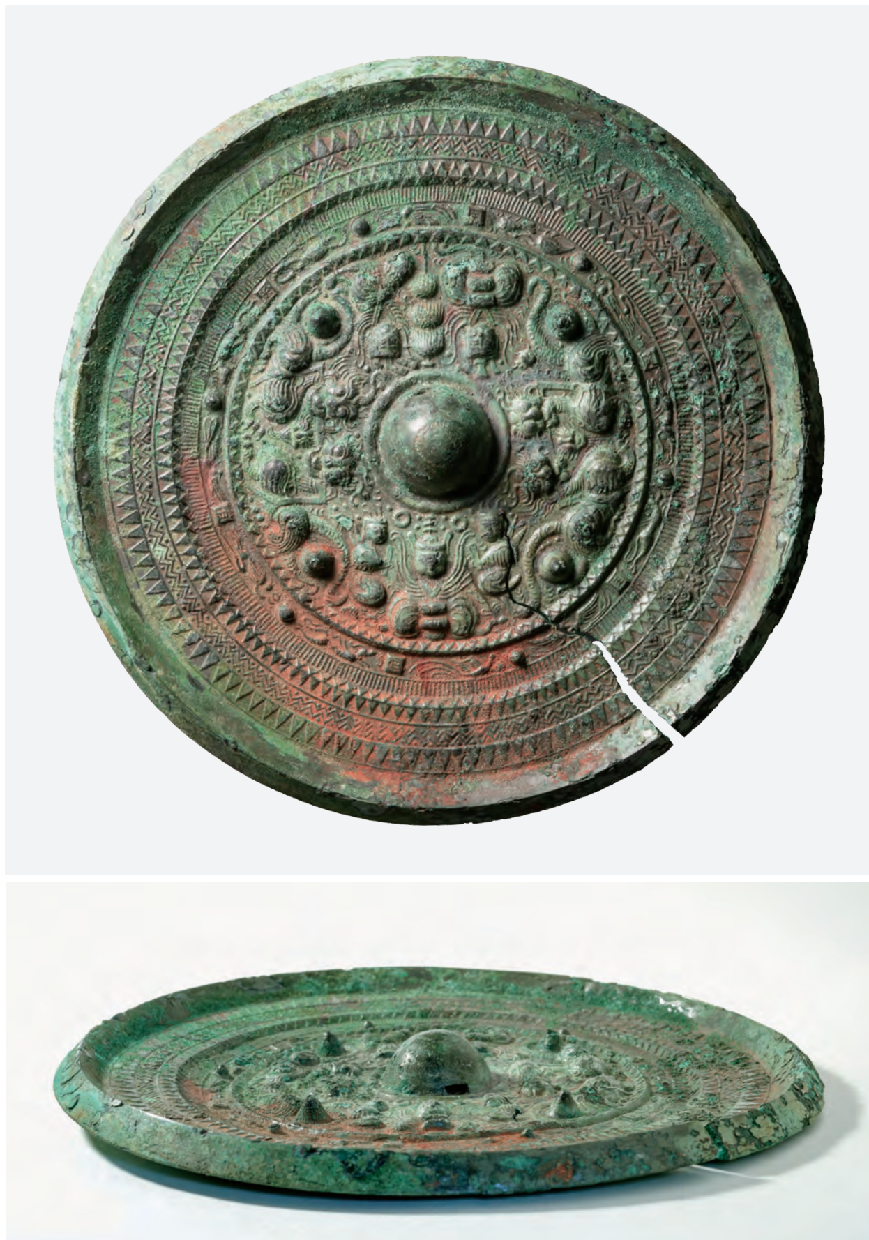
三角縁・天・王・日・月・獸文帯三神四獸鏡（鏡3）