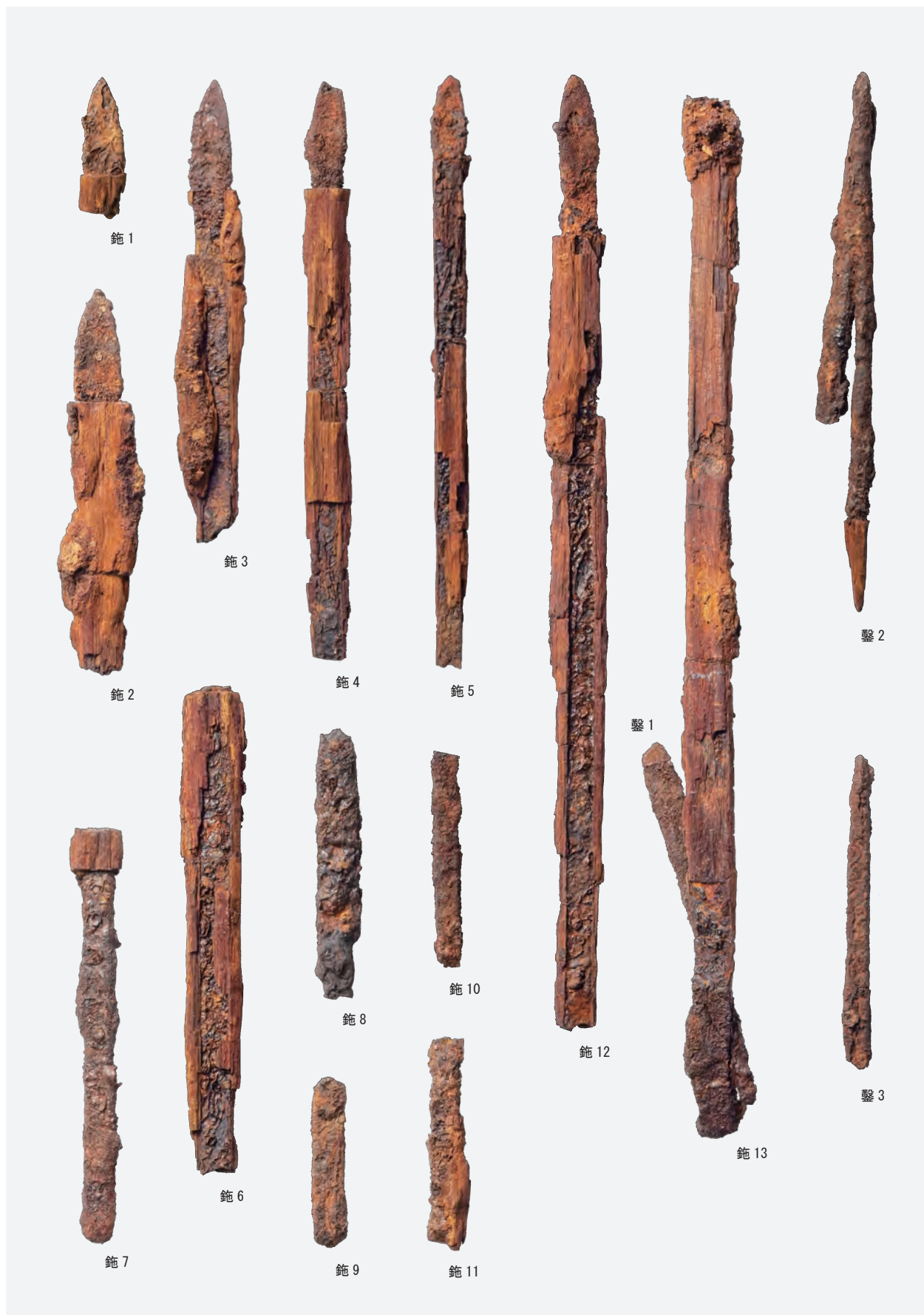
鐵鈹・鐵鑿（下面・側面）