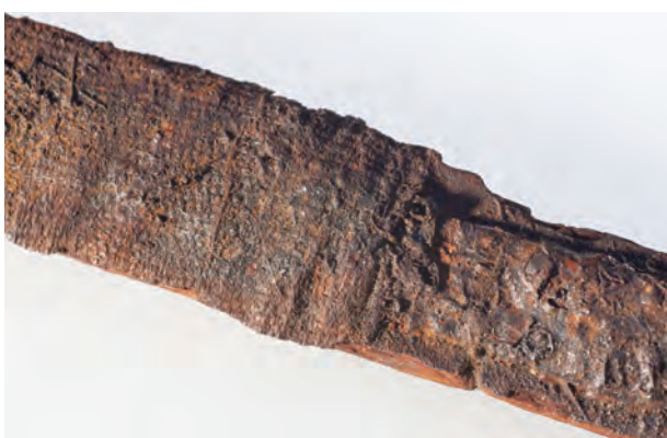
8 鉞 12 の布巻きの末端