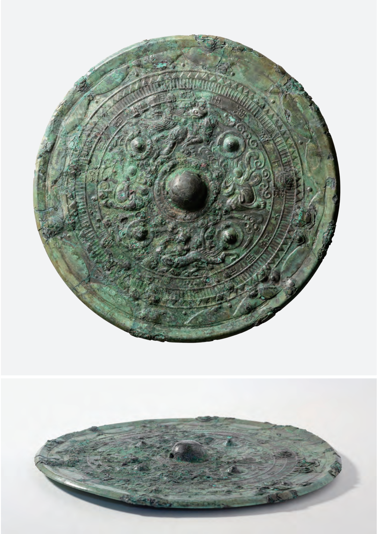
同向式二神二獸鏡（鏡2）