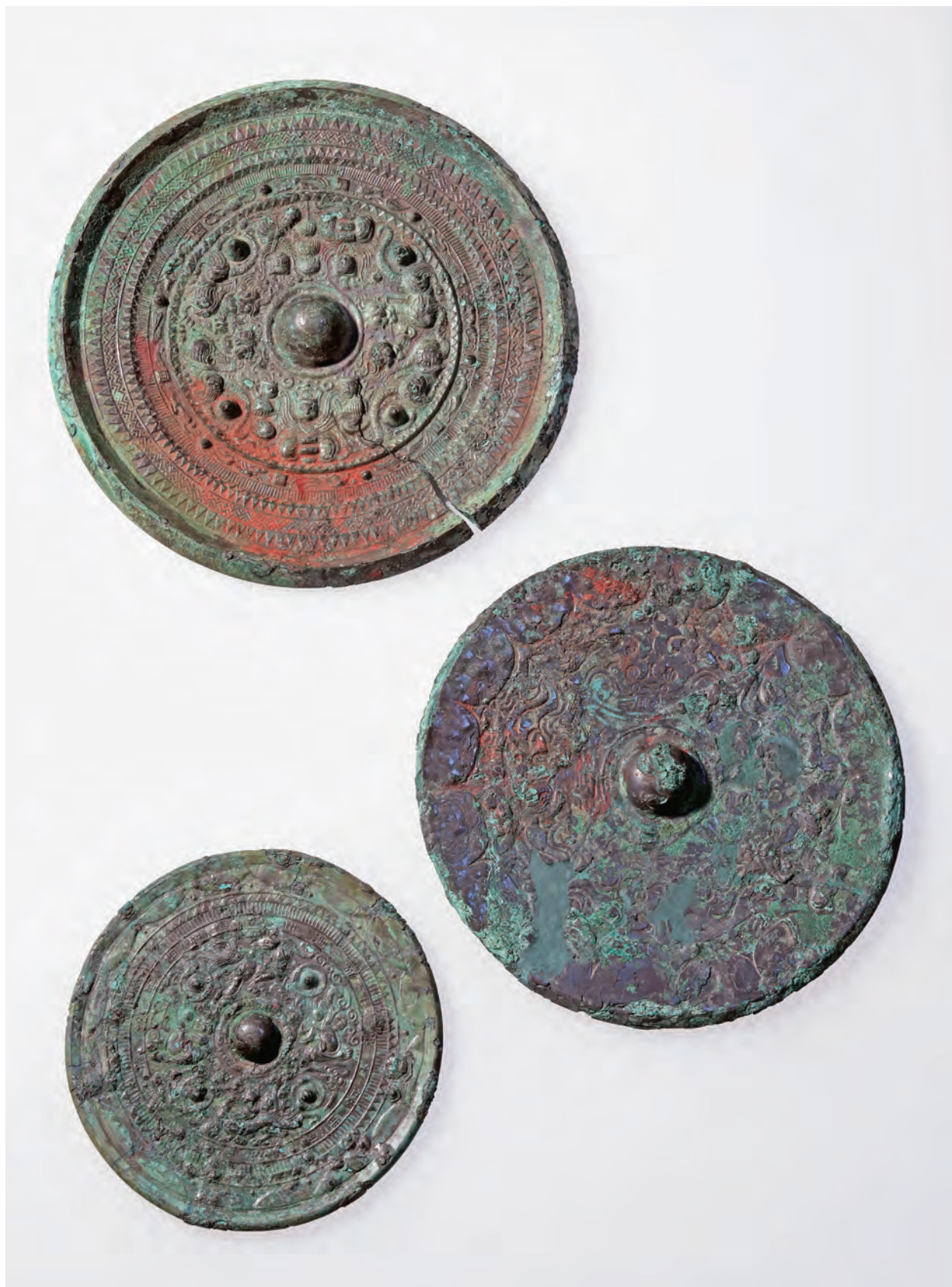
伯耆国分寺古墳出土銅鏡