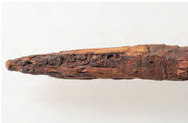
2 短刀 1 (2) の把間側面孔