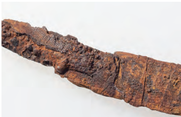
5 鉞 3 の把縁の形態