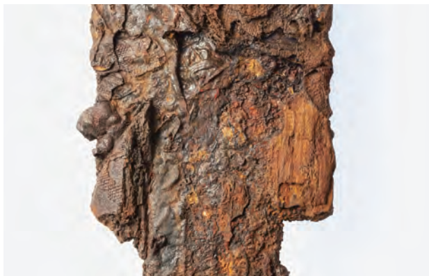
1 ヤリ 2 (5) の把縁