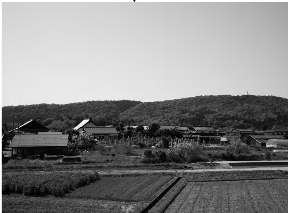
国府川から望む伯耆国分寺古墳（南東から）