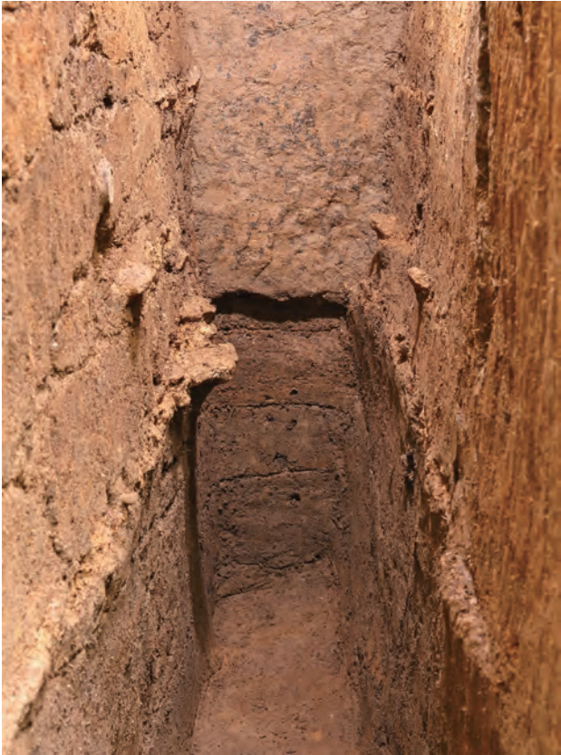
1 SW区サブトレンチ玄室下位の盛土・地山(西から)