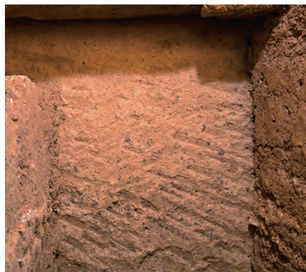
4 玄室棺身東側壁外面上部チョウナ敲打痕（東から）