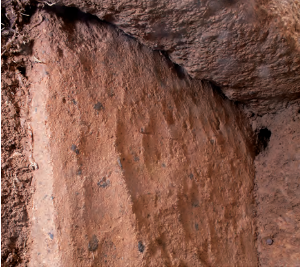
1 玄室棺身北小口外面上部チヨウナ削り痕(北東から)