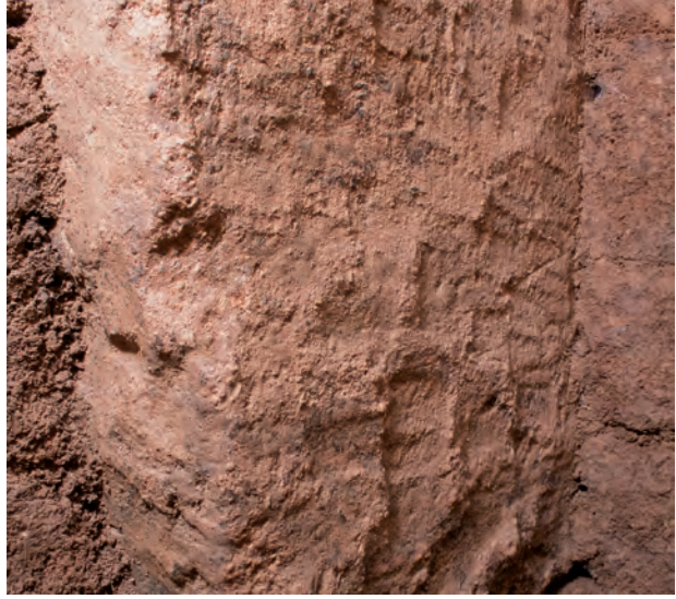
2 玄室棺身北小口外面下部チヨウナ加工痕(北東から)