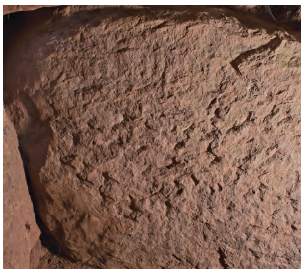
5 羨道東側壁基底石チョウナ敲打痕（西から）