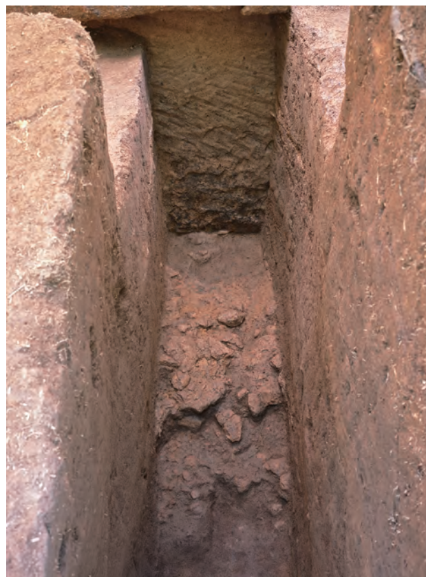
1 SW区サブトレンチ石材加工剥片出土状況(西から) 2 SE区第1サブトレンチ石材加工剥片出土状況(東から)