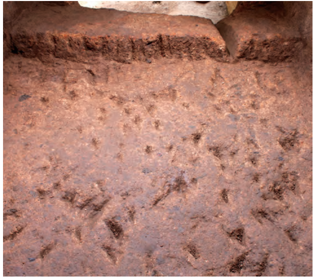
4 玄室棺身床面チヨウナ敲打痕(北から)