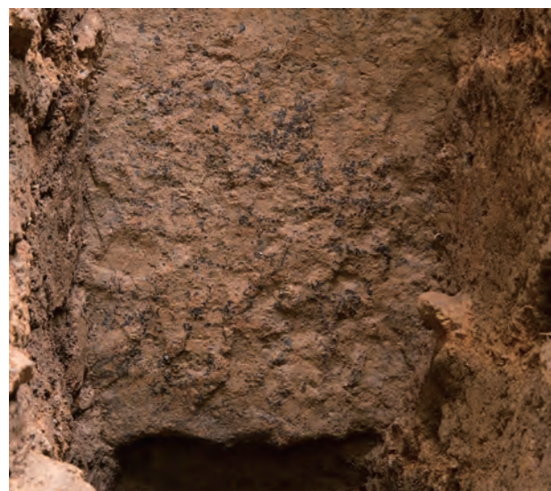
6 玄室棺身西側壁外面下部チョウナ加工痕（西から）