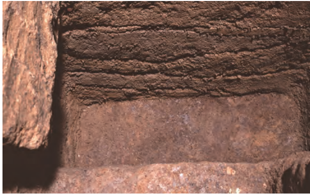
4 NE区拡張サブトレンチ玄室下位の盛土・地山(東から)