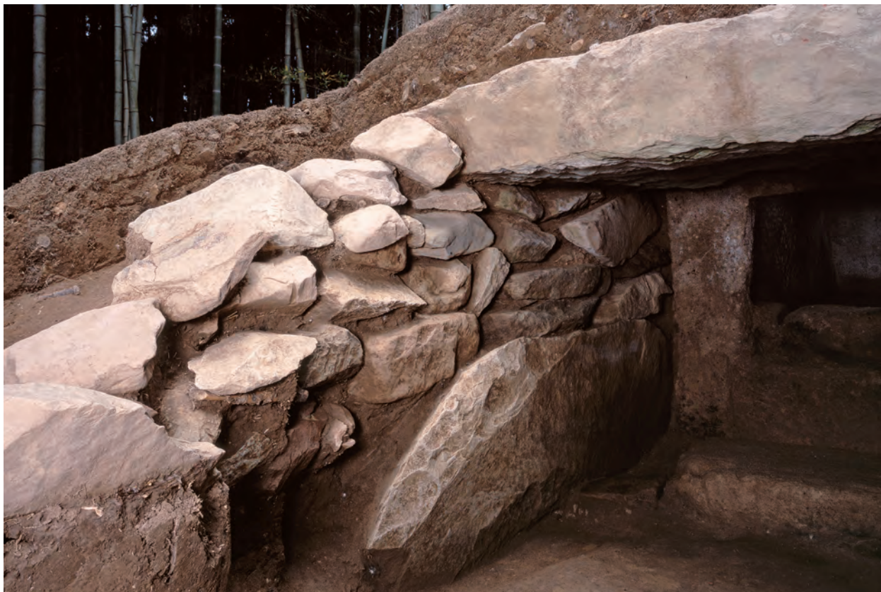
1 羨道西側壁（南東から）