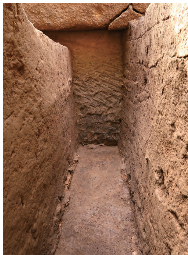
3 SW区サブトレンチ玄室設置面(西から) 4 SE区第1サブトレンチ玄室設置面(東から)