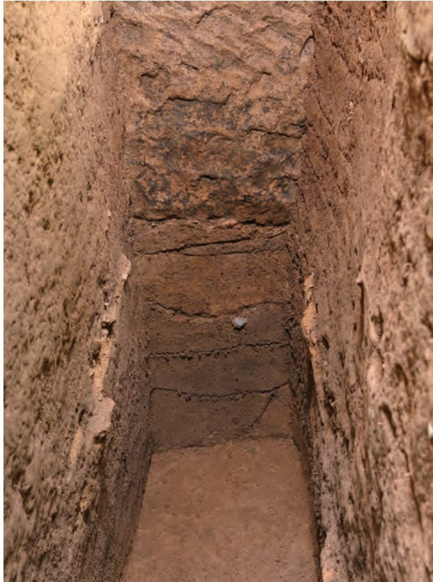
2 SE区第1サブトレンチ玄室下位の盛土・地山(東から)