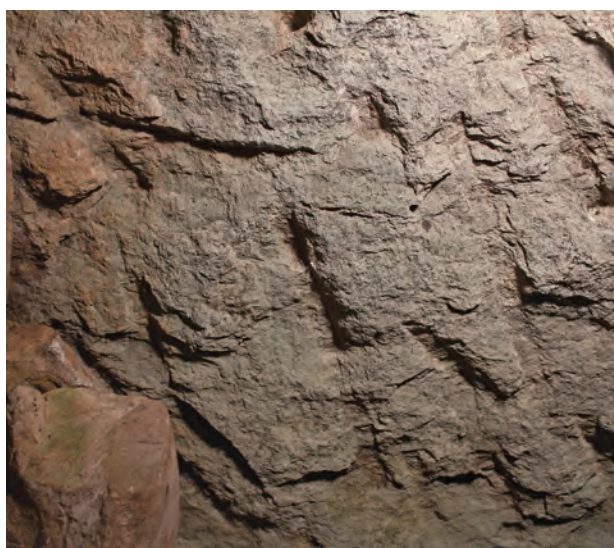
3 羨道天井石下面ノミ加工痕（下が北）