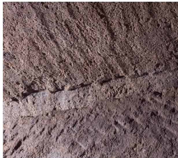
2 玄室棺身・天井石内面南東部チョウナ削り痕（西から）