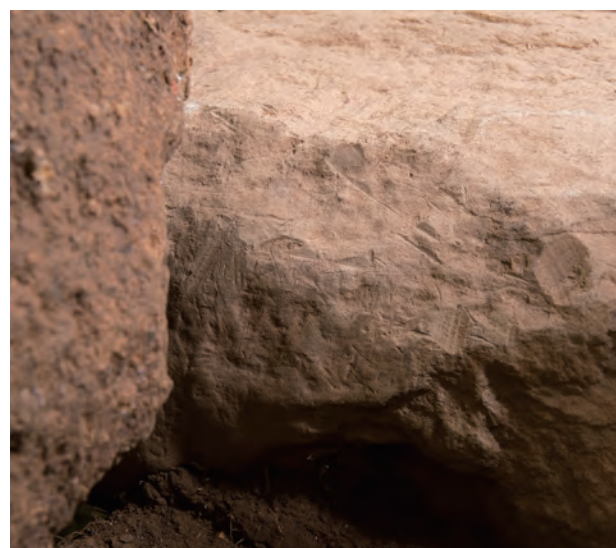
4 羨道天井石北側面加工痕（北から）