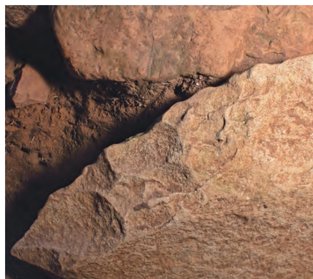
6 羨道西側壁基底石剥離加工痕（東から）