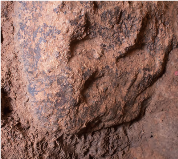
3 玄室棺身北小口外面下部チヨウナ敲打痕(北東から)