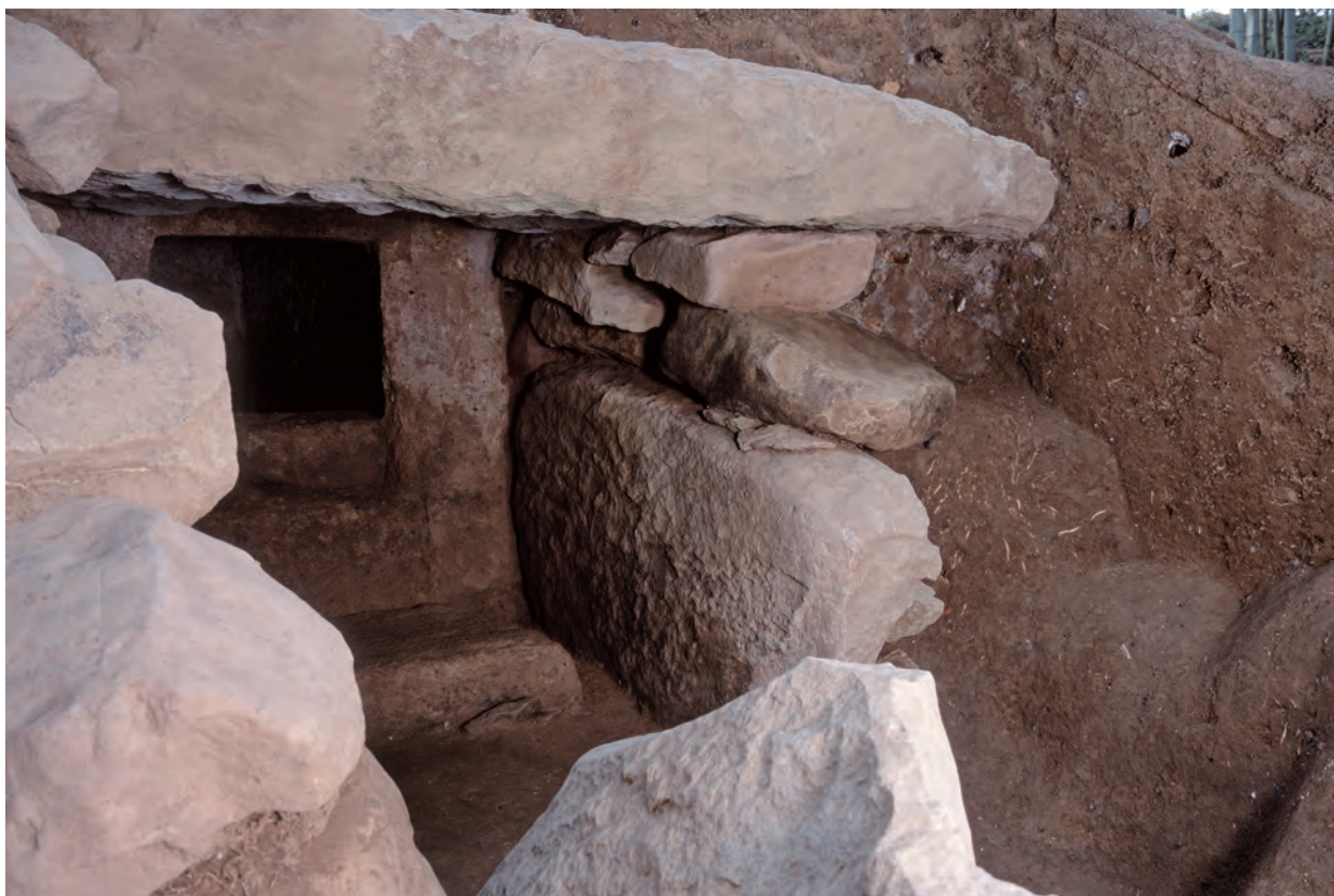
2 羨道東側壁（南西から）