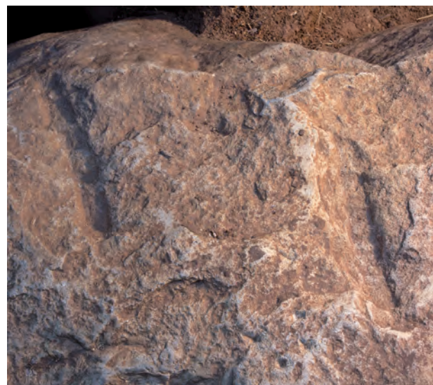
2 羨道天井石上面ノミ加工痕（下が南西）