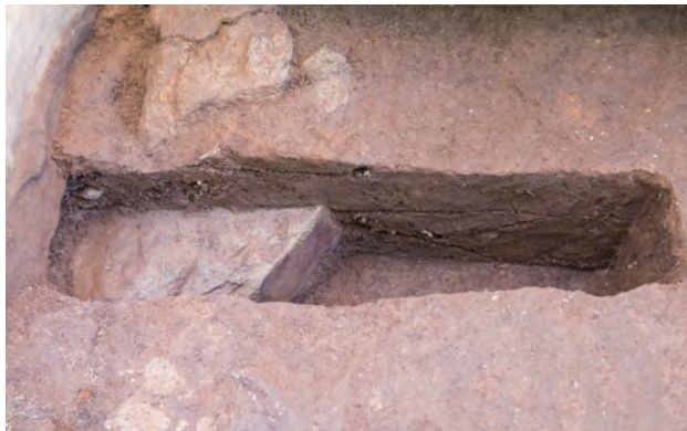
5 SE区第2サブトレンチ羨道壁体・盛土(東から)