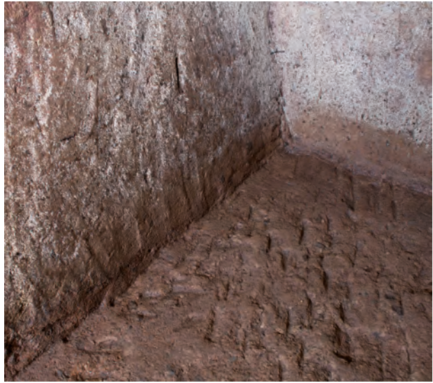
6 玄室棺身内面北西隅チヨウナ加工痕(南東から)