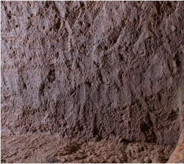
5 玄室棺身右側壁内面チヨウナ削り痕(西から)