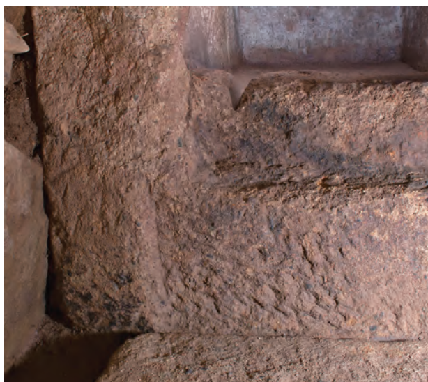
3 玄室棺身南小口外面玄門下部チョウナ敲打痕（南から）