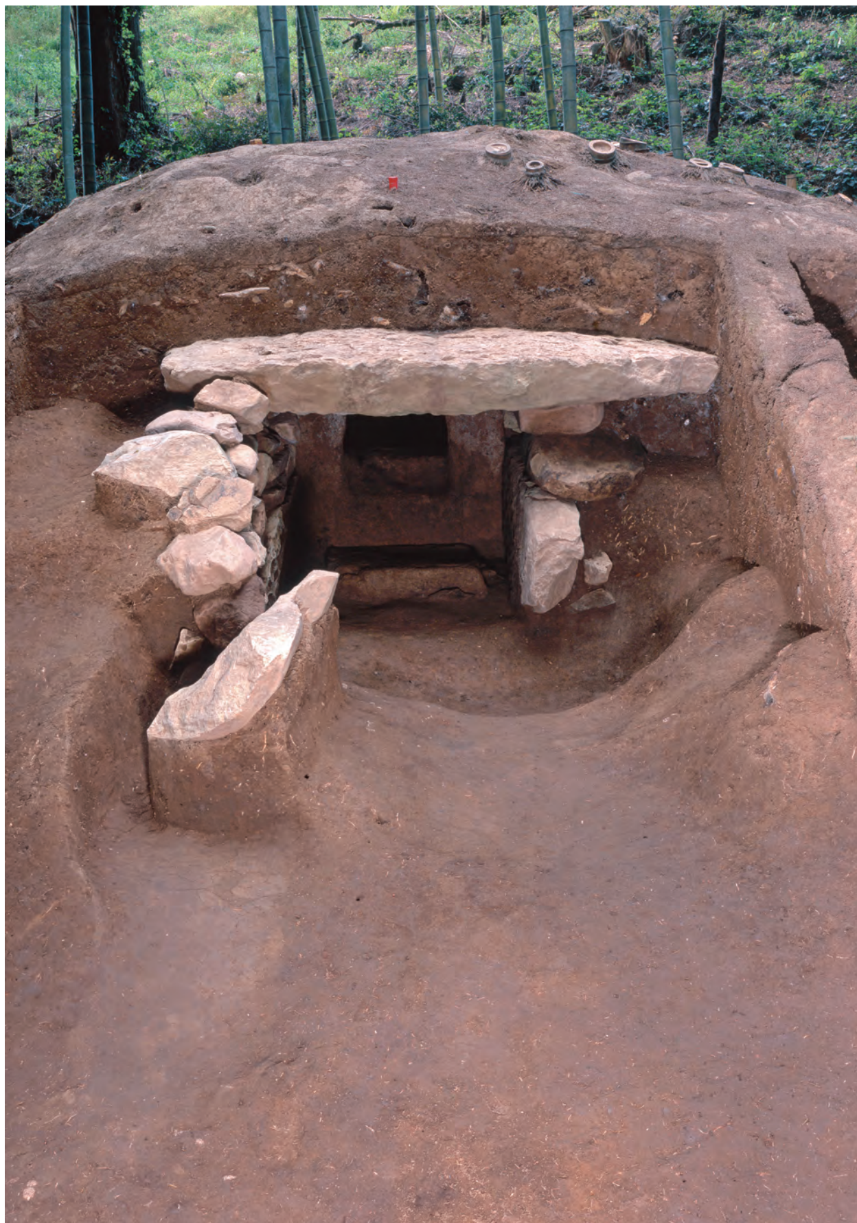
羨道・前庭部（南から）