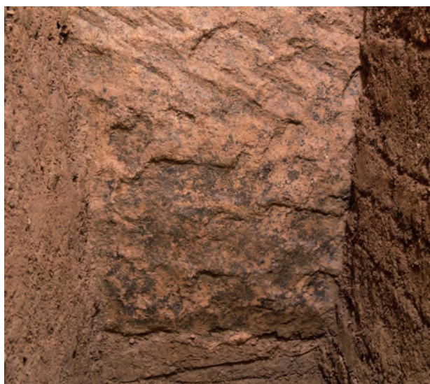
5 玄室棺身東側壁外面下部チョウナ加工痕（東から）