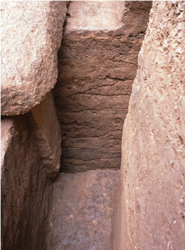
3 NE区拡張サブトレンチ玄室設置面(東から)