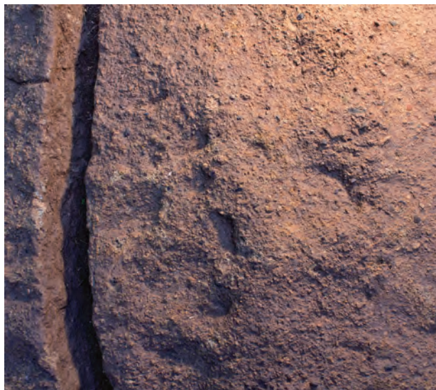
1 玄室天井石外面中央部付近チョウナ敲打痕（下が南）