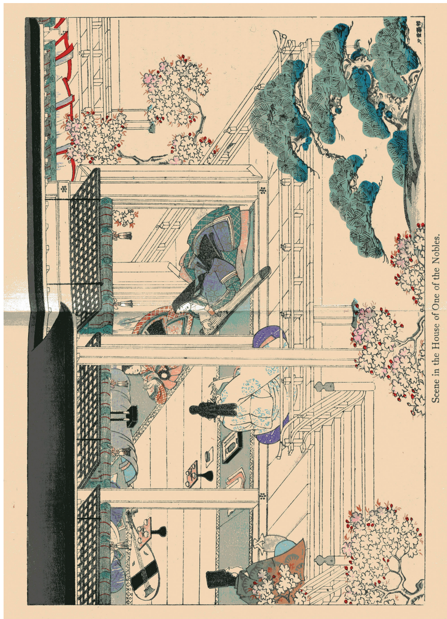
Scene in the House of One of the Nobles.