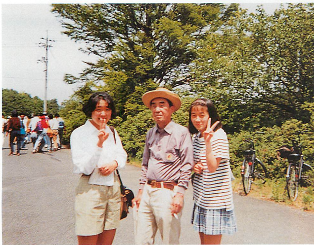
野外実習の指導で. 相変わらずタバコを手に“ハイポーズ”.