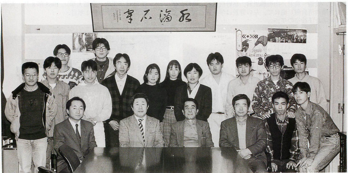
ゼミ生との卒業記念撮影（地質学演習室にて，1992年冬）. 平成4年度学部・大学院卒業予定生とともに. 中央上の額は島根大学初代学長山根新次先生によるもの.