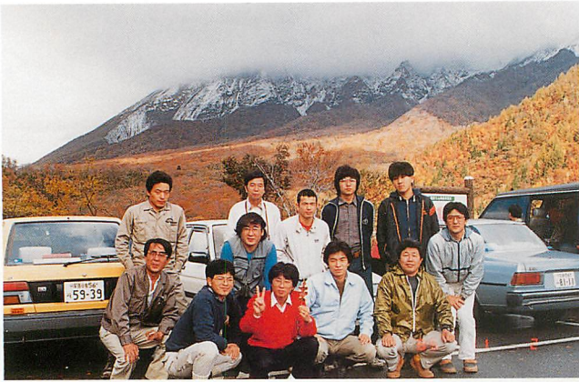
大山でのゼミ合宿を終えて（1991年11月）. 地史学講座の4年生，院生および教官と。