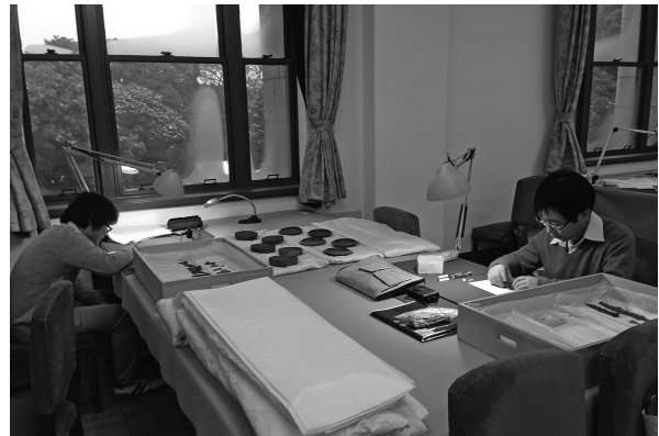
2. 実測図作成状況 (2015年1月)