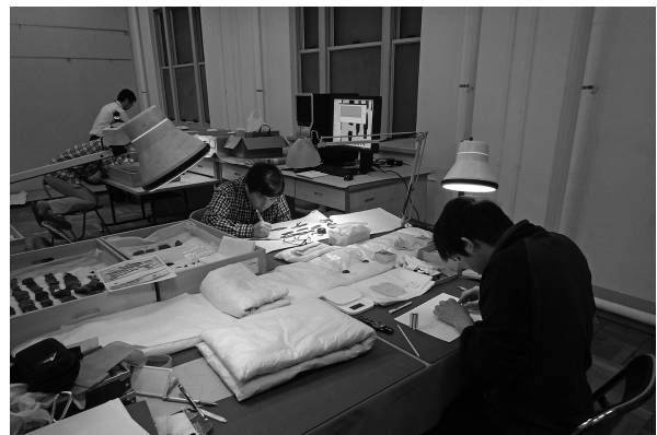
3. 実測図作成状況 (2016年3月)