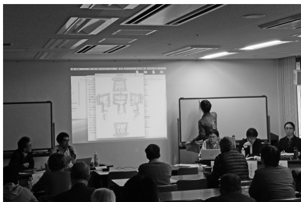
1. シンポジウムの開催 (2016年11月)