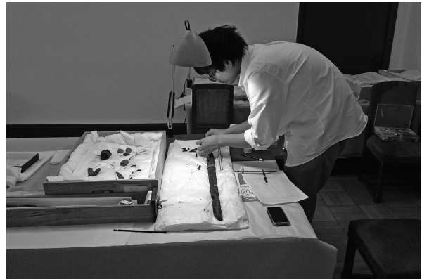
1. 鉄製品の接合検討 (2014年7月)

埋葬施設の二次資料化 古天神古墳をめぐる論点として、副葬品が出土した後方部埋葬施設を出雲型石棺式石室との関係のなかでいかに評価しうるかは、本研究の学術的意義を高めるうえで不可避な議論である。そこでこの課題を解決する基礎的な材料を得るため、島根県教育庁文化財課ならびに島根県教育庁埋蔵文化財調査センターのご理解とご協力を得て、後方部に露出している埋葬施設を対象とした調査を実施した。調査は現状の記録を目的として、実測図作成と写真撮影をおこなった。調査は2017年3月21日より着手し、土日など休日を利用して4月29日に完了した。実働日数は14日間である。なお、写真撮影に際しては、SfM (Structure from Motion) による画像処理をベースとした三次元形状復元技術に資するためのデータを得るよう努めた。写真撮影は3日間を要した。埋葬施設の二次資料化にあたっての作業は、岩本崇と岩本真実があたった。三次元モデルの作成は、岡本篤志氏(大手前大学史学研究所)に依頼した。