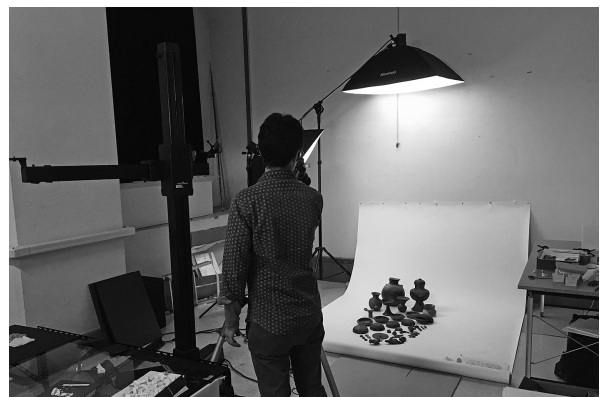
4. 写真撮影状況 (2016年11月)