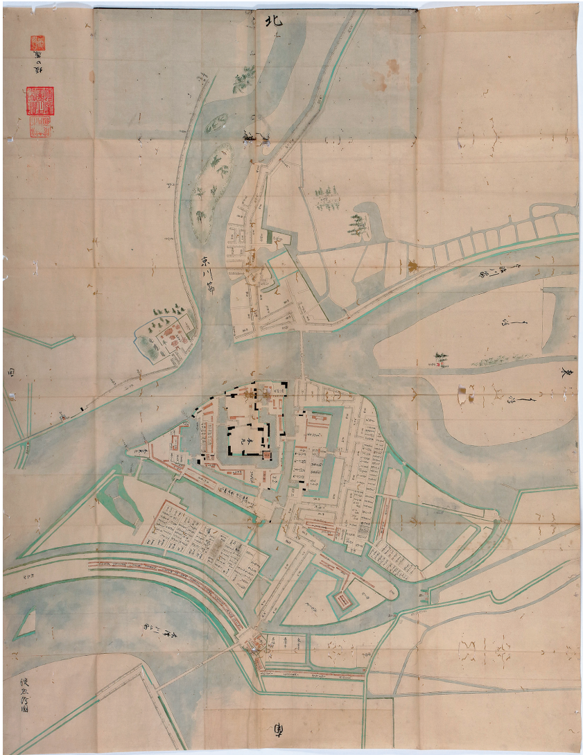
淀物絵図（全体） （西尾市岩瀬文庫所蔵）