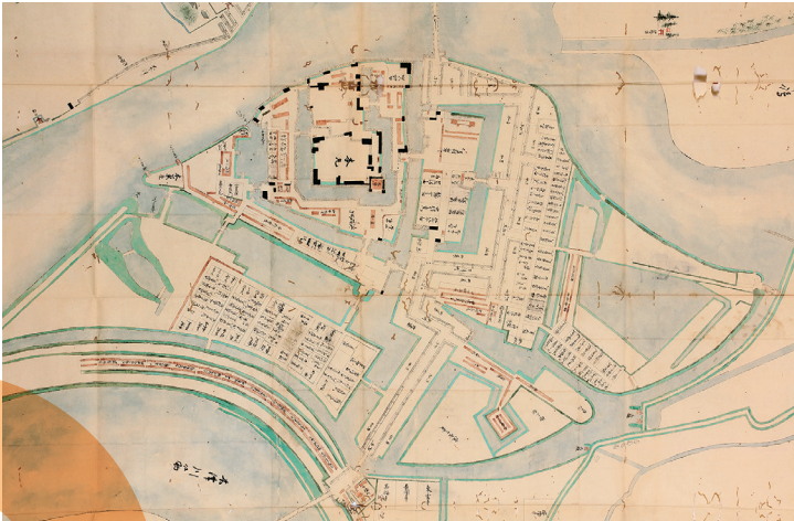
淀惣絵図(城下町中心部)